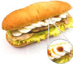
ガーリックソース

てりやき味のローストチキンと 半熟たまごをバルサミコ酢 テリヤキソースで合わせまし た。ガーリックソースが アクセントです。