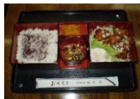
11/21~11/30 ユーリンチー弁当